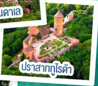
ปราสาทกูไรต์