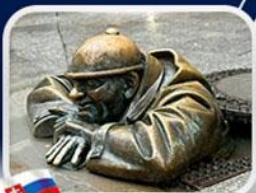
ประติมากรรม Cumil

มาเรียนพลาซซ์ • บ้านเกิดโมซาร์ท • พระราชวังฮอฟบวร์ก • ซาลส์บวร์ก • บ้านเกิดโมซาร์ท • เกรโกเดร์สตรีก • ทะเลสาบคอนิกซ์ • หมู่บ้านอัลส์สตัดท์ • อนุสาวรีย์มาเรียเทเรซา