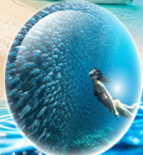
MOALBOAL ISLAND HOPPING (ดำน้ำดูปลา, เต่า, ว่ายน้ำกับปลาชาร์ตัน)