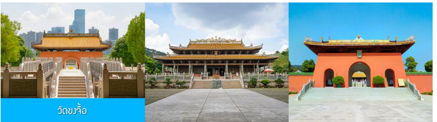
วัดขงจื้อ

เช้า บริการอาหารเช้า ณ ร้านอาหารในโรงแรม (8)