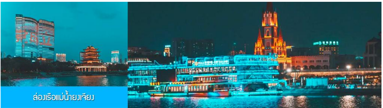
ล่องเรือแม่น้ำยวเจียง

ไกด์ท้องถิ่นนำเสนอ โปรแกรมทัวร์เสริม OPTIONAL TOUR ล่องเรือแม่น้ำยวเจียงชมแสงสียามค่ำของเมืองหนานหนิง..... อัตราค่าบริการสำหรับโปรแกรมเสริมเมืองลับแล ท่านละ 250 หยวน ใช้เวลาประมาณ 1 ชั่วโมงครึ่ง ค่าบริการรวม ค่าบัตรเข้าชม ค่ารถรับ ส่ง และค่าน้ำเที่ยวของไกด์ท้องถิ่น