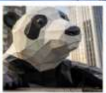
ห้าง IFS หมีแพนด้าปิงตึก