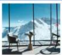
4860 COFFEE SHOP