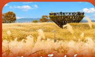
สวนฮานิลปาร์ก