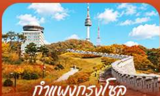
ทำแพนกรังโซลแบบบอมบ์แควร์

ออกเดินทางสู่ร่องราวแห่งฤดูใบไม้เปลี่ยนสี สัมผัสความงดงามของเกาะบาบีและอุทยานแห่งชาติชอรัคซาน เพลิดเพลินกับความสนุกเต็มอิ่มที่สวนสนุกเอเวอร์แลนด์ • เก็บภาพความประทับใจท่ามกลางทุ่งหญ้าสีทอง และโบมีหลากหลายที่สวนฮานิลปาร์ก • พร้อมชมวิวหอคอยนิรันดร์จากแบบคอนสแตนท์ • เติมเต็มความสุข ด้วยการลิ้มลองสตรีทฟู้ดรสเลิศที่ตลาดบึงวอน • ก่อนเพลิดเพลินกับการช้อปปิ้งในกรุงโซลตลอดทริป