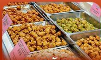
ตลาดบึงวอน