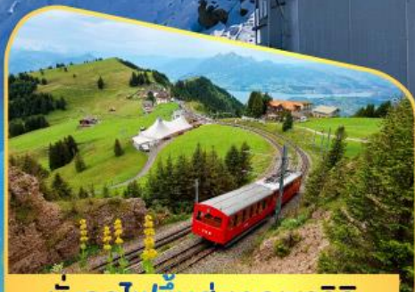
นั่งรถไฟขึ้นสู่ยอดเขาโรทิก