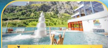
แช่น้ำแร่ร้อนผ่อนคลายลวยคอร์บิค