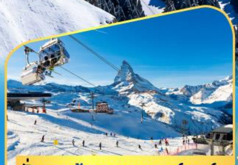
นั่งกระเช้าชมแมทเทอร์ฮอร์น