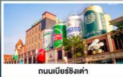
ถนนเบียร์ชิงเต่า