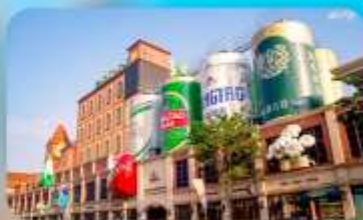
ถนนเบียร์ชิงเต่า