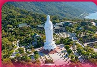
องค์กวนอิม วัดหลินอิ่ง