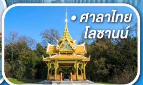
• ศาลาไทย โลซานน์