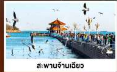
สะพานจ้านเฉียว