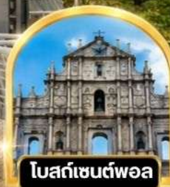
โบสถ์เซนต์ฟอล