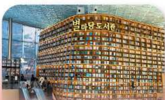
ห้องสมุดสตาร์ฟิล