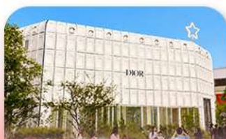
บรูกลินกาหลี