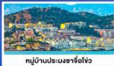
หมู่บ้านประมงซาโจ่ว