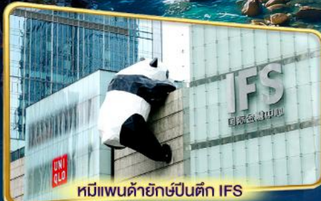
หมีแพนด้ายักษ์ปีนตึก IFS