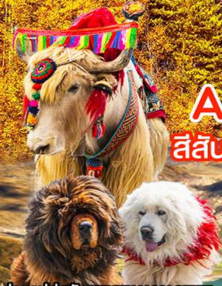
ถ่ายรูปคู่สุนัข TIBETAN MASTIFF จามรี และแพะ ทะเลสาบยิมดรก

สีสันแห่งฤดู บนดินแดนแห่งศรัทธา หลินจือ • ลานา