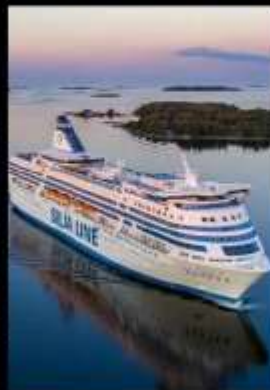
SILJA LINE OVERNIGHT CRUISE