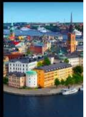
เที่ยว 4 เมืองหลวง แห่งสแกนดิเนเวีย