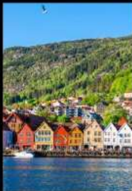
เมืองท่าแสนสวย เบอร์เก็น