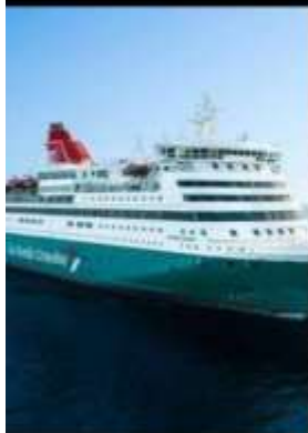
GO NORDIC OVERNIGHT CRUISE