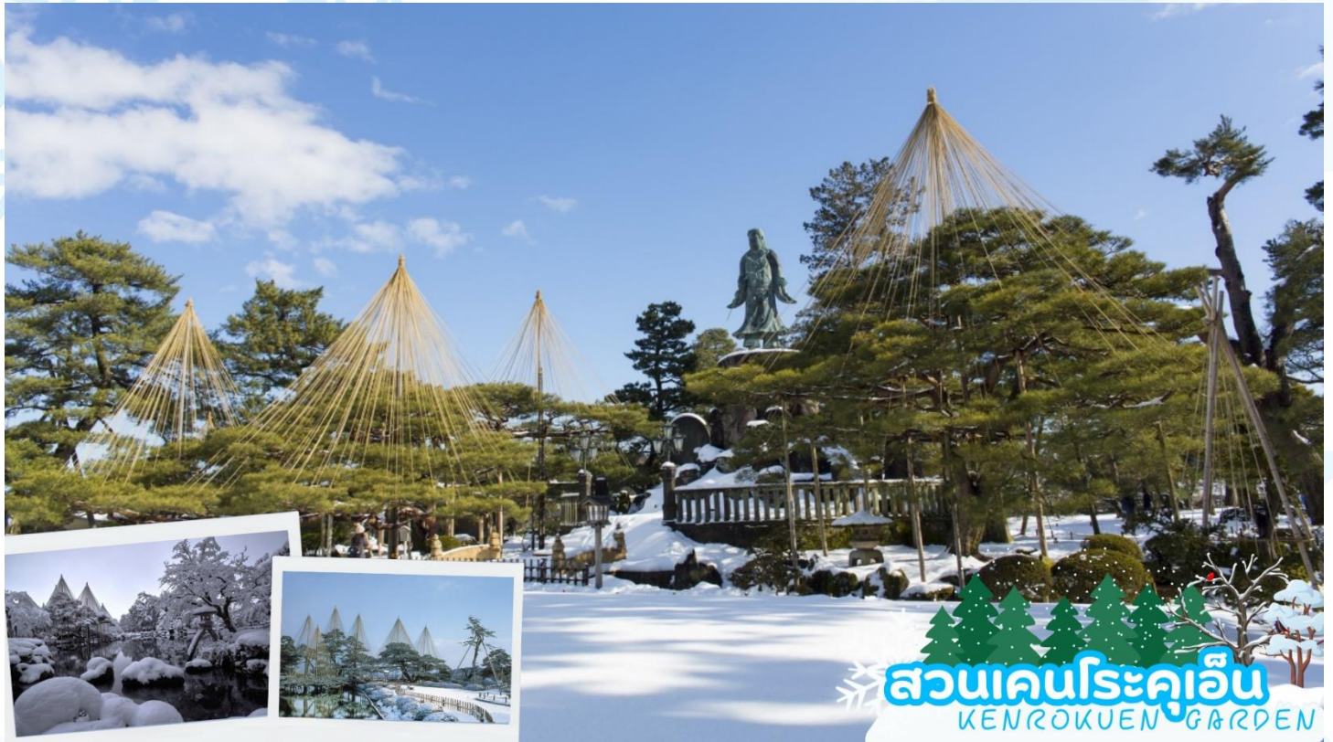
สวนเคนโรคุเอ็น KENROKUEN GARDEN

ล่องเรือสำราญโชกาวะ (Shogawa Gorge Cruise) จังหวัดโทยามะ เพลิดเพลินไปกับการล่องเรือชมทิวทัศน์ที่งดงามของธรรมชาติ ทั้ง 4 ฤดู ซึ่งเติมเต็มสีสันด้วยสีเขียวข่มและใบไม้เปลี่ยนสีที่ช่างงดงามวิจิตร แต่ละฤดูกาลก็จะมีความสวยงามที่แตกต่างกันออกไป ล่องเรือไปกลับจากเขื่อนโคะมากิ (Komaki) ณ หุบเขาโชกาวะถึงออนเซ็นโอะมากิ (Omaki) ใช้ระยะเวลาประมาณ 1 ชั่วโมง หุบเขาโชกาวะ แห่งนี้โด่งดังเรื่องทัศนียภาพหิมะที่ลึกลับและงดงาม รวากับภาพวาดหมึกจีน ล่องเรือชมบรรยากาศที่รายล้อมไปด้วยหิมะและทิวทัศน์ที่งดงามของธรรมชาติอันอุดมสมบูรณ์