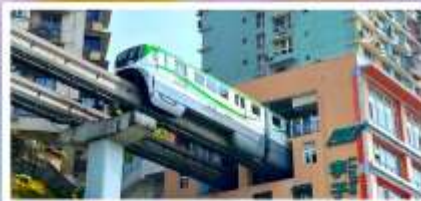
รถไฟฟ้าลู่ติ๊ก