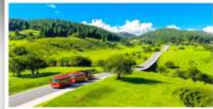
เวนางฟ้า

เดินทางโดย: สายการบินดงซิ่งเจียงเป่ย์ (PN)