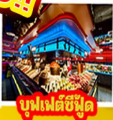
บูฟเฟต์ซีฟู้ด