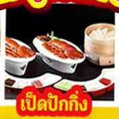
เปิดปิ้งกั๊ง