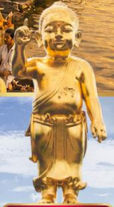
องค์พระพุทธรูปเจ้าน้อย