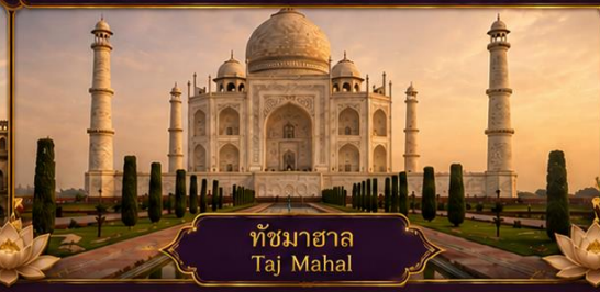
ทัชมาฮาล Taj Mahal