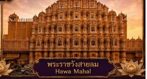
พระราชวังสายลม Hawa Mahal