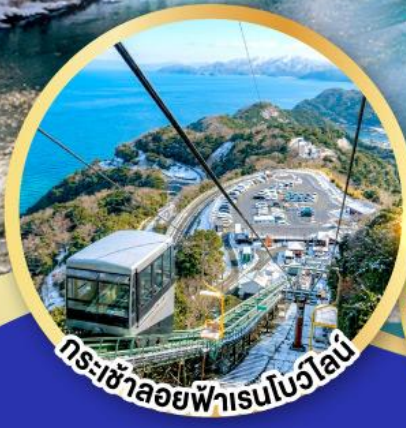
กระเช้าลอยฟ้าเรนโบว์ไลน์