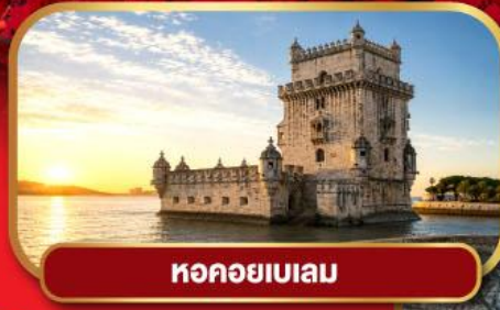
หอคอยเบเลม