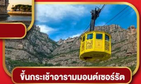
ขึ้นกระเช้าอารามมอนต์เซอรัลด์