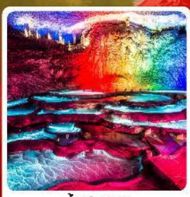
ถ้ำเก้าเทพ