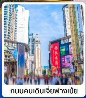
ถนนคนเดินเจียฟางเป็ย