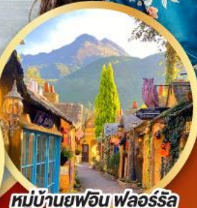
หมู่บ้านยูฟูอิน ฟลอร์ริล