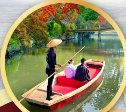
กิจกรรมล่องเรือยามากาวะ