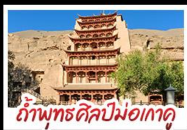
กำแพงพุทธศิลป์ม่อเถาตุ

เป็นทรายครวญ - สระน้ำวังพระจันทร์ ทะเลสาบเกลือฉาซ่า - กำพุทธรศิลป์ม่อเถาตุ หุบเขาสายรุ้งจางเย่ - ทะเลสาบซิงไห่