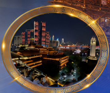
มือตำร้านอาหารวิวหลักล้าน ชมแสงสีเมืองลงซิ่ง