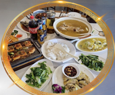
โต๊ะจีนลงซิ่ง เมนูต้นตำรับ รสจัดจ้านแท้ๆ