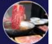
ปิ้งย่างพรีเมียม ROKKASEN เนื้อคุณภาพ