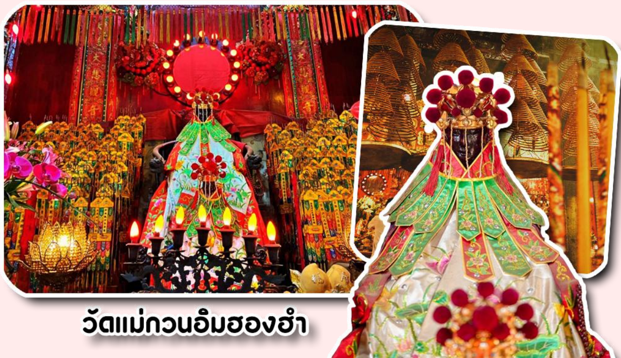
วัดแม่กวนอิมฮองฮำ

พาท่านเดินทางไปไหว้ขอพรขอเงิน วัดแม่กวนอิมฮองฮำ วัดเก่าแก่ของฮ่องกงสร้างตั้งแต่ปี ค.ศ. 1873 เป็นวัดขนาดเล็กที่มีชาวฮ่องกงศรัทธาหนักถือกันเป็นอย่างมาก วัดแห่งนี้เป็นที่ประดิษฐาน องค์เจ้าแม่กวนอิมฮองฮำ ที่มีชื่อเสียงเรื่องการให้กู้ยืมเงิน เชื่อกันว่าท่านช่วยพลิกฟื้นเศรษฐกิจของชาวฮ่องกง ผู้คนจึงนิยมมายืมเงินทำธุรกิจจนสำเร็จร่ำรวย รุ่งเรือง โดยให้ท่านอธิษฐานขอพรต่อหน้าเจ้าแม่กวนอิมฮองฮำ พร้อมกับระบุวันเวลาในการขอพรด้วย จากนั้นนำธนบัตรตามฐานะและศรัทธาที่เราจะนำเป็นสื่อในการขอพร เขียนจำนวนเงินที่ต้องการลงไปด้วย ใส่สกุลเงินยี่งดีใหญ่ แล้วนำเงินใส่ในซองแดง ควรเตรียมซองแดงไปเอง นำซองแดงไปวนรอบกระถางรูป วนขวาจำนวน 3 ครั้ง แล้วเก็บซองแดงในกระเป๋าสตางค์ เป็นเงินขวัญถุง ถ้าประสบความสำเร็จตามที่มุ่งหวังให้นำเงินในซองแดงทำบุญหยอดตู้ที่วัดแห่งนี้ในโอกาสต่อไป วิธีไหว้ให้ปัง ให้ได้โชคลาภเงินทอง ต้องไปกับเราเท่านั้น