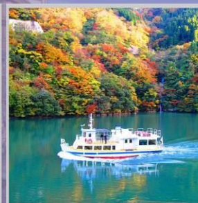
"SHOGAWA YURAN CRUISE"