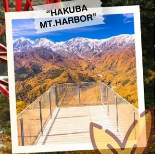
"HAKUBA MT. HARBOR"

วันเดินทาง 28 ต.ค. - 3 พ.ย. 2569 4 - 10 , 11 - 17 พ.ย. 2569