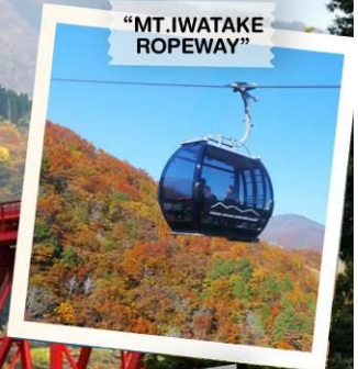
"MT. IWATAKE ROPEWAY"