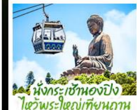
นั่งกระเช้าเองปีง ไฮวีพระใหญ่เทียนถาน