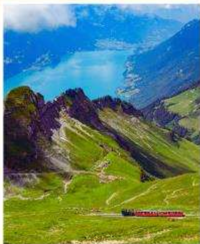
BRIENZER ROTHORN Sorenberg Schonenboden