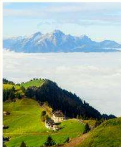
RIGI KULM Queen of the Mountains