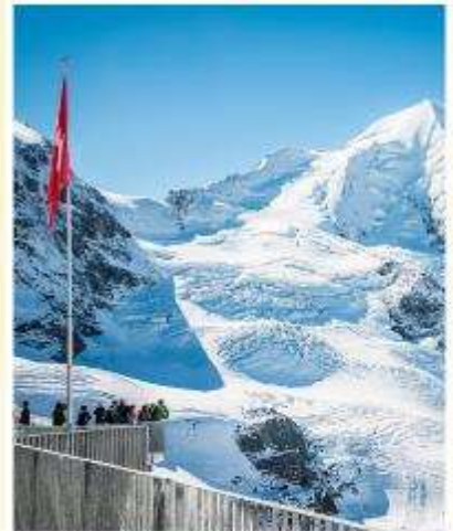
DIAVOLEZZA Piz bernina Peak