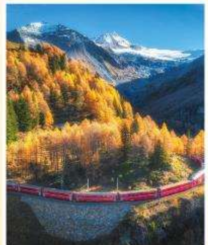
BERNINA EXPRESS Unesco