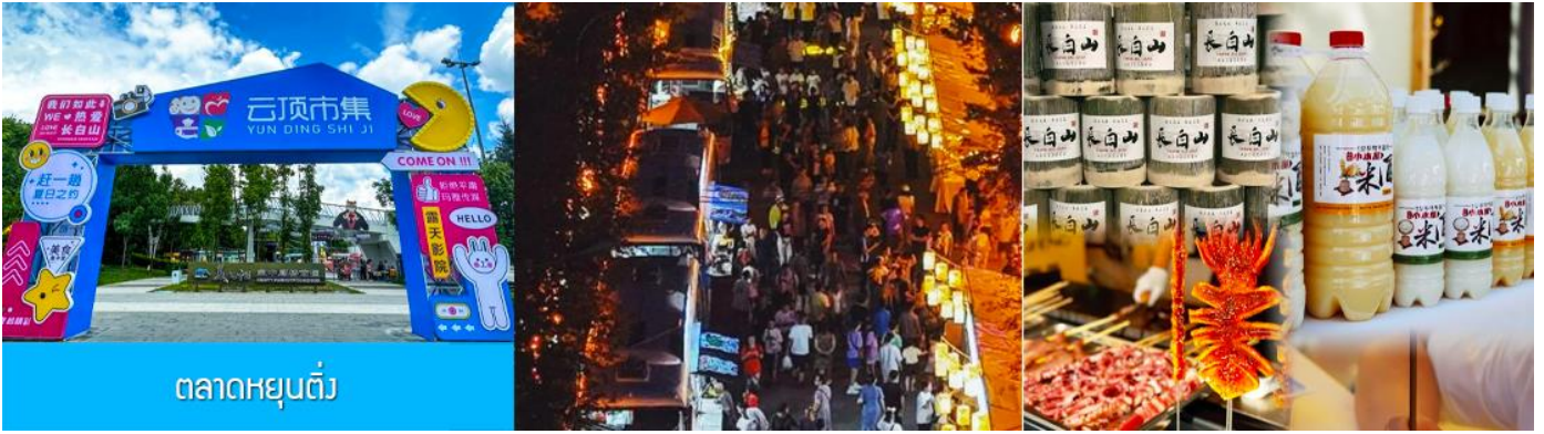
ตลาดหยุนต้ง