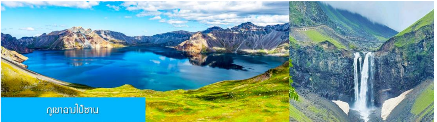
ภูเขาฉางไป่ชาน

วันที่สาม ภูเขาฉางไป่ชาน –ทะเลสาบเทียนฉือ-น้ำตกฉางไป่ชาน-สระน้ำมรกต-หมู่บ้านวัฒนธรรมเกาหลี เช้า รับประทานอาหารเช้า ณ ห้องอาหารของโรงแรม (4)