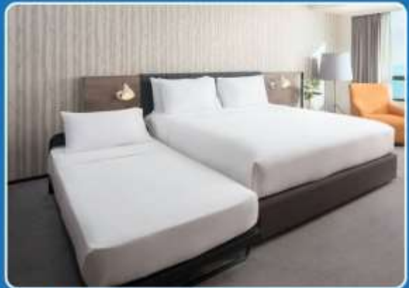
👤👤+👤 TRIPLE (TRP)

**รูปภาพห้องพักเป็นเพียงภาพสื่อถึงประเภทของเตียงเท่านั้น ไม่ใช่ภาพห้องพักจริงสำหรับการเข้าพัก**