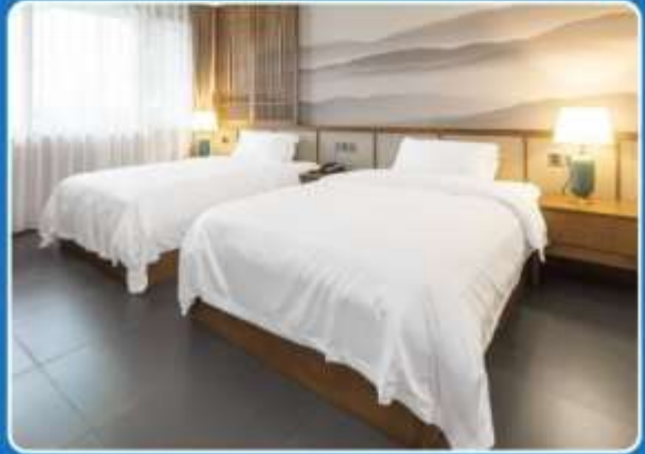
👤👤 TWIN (TWN)