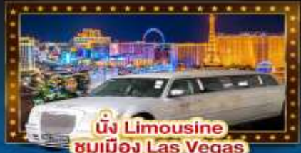
นั่ง Limousine ชมเมือง Las Vegas