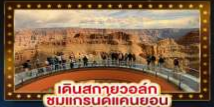
เดินสกายวอล์ก ชมแกรนด์แคนยอน