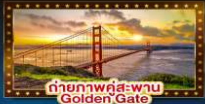
ถ่ายภาพคู่สะพาน Golden Gate