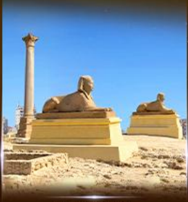
เสาสีเนมปอนเบย์