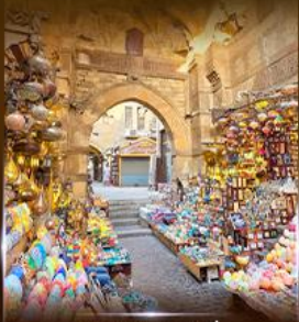
ตลาดงานเวอลาสี