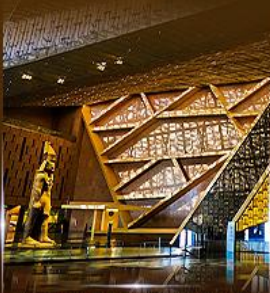
พิพิธภัณฑ์ไทรนดิวียิปต์ (GEM)