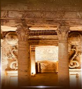
สุสานใต้ดินอเล็กซานเดรีย