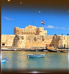
บึงนรากรม Quite Bay