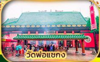
วัดพ่อแซกง