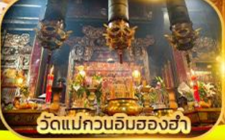
วัดแม่กวนอิมของฮ่า