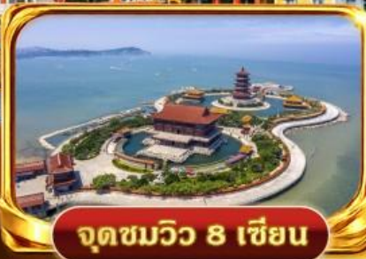
จุดชมวิว 8 เชียง