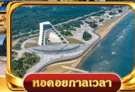
หอดอยกาลเวลา