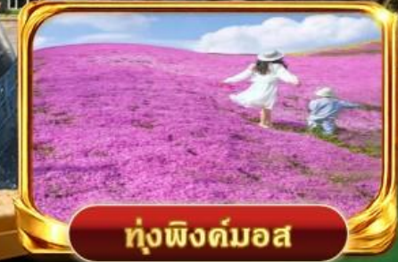
ท่งฝิงคัมออส