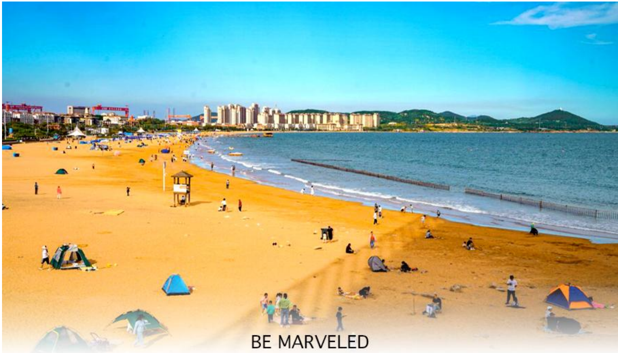
BE MARVELED หาดจินซาตาน

และชม หาดจินซาตาน ตั้งอยู่ในเขตหวงเต่า ของเมืองชิงเต่า มณฑลซานตง เป็นชายหาดที่ใหญ่ที่สุดและสวยที่สุดแห่งหนึ่งในเมืองชิงเต่า มีชื่อเสียงจากเม็ดทรายที่ละเอียดและมีสีเหลืองทองระยิบระยับ น้ำทะเลใสสะอาดและมีกิจกรรมหลากหลาย เช่น ว่ายน้ำ วอลเลย์บอลชายหาด และเครื่องเล่นทางน้ำ มีการจัดเทศกาลวัฒนธรรมและการท่องเที่ยวหาดทรายทองเป็นประจำทุกปีในช่วงฤดูร้อน