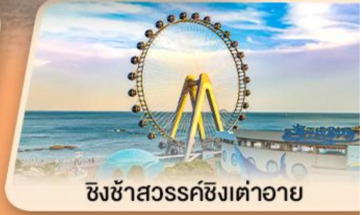
ชิงช้าสวรรค์ซิงต้าอาย