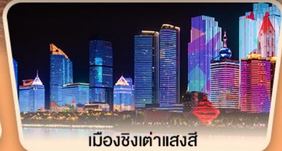
เมืองซิงต้าแสงสี