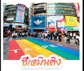
ซีเหมินดิง