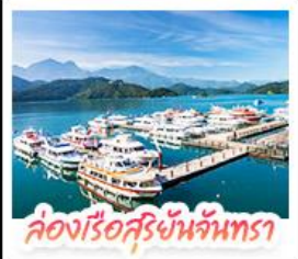
ล่องเรือสุริยจันทร์

ล่องเรือชมทะเลสาบสุริยจันทร์ (SUN MOON LAKE) ชมเกาะลาลู แวง-วัดสวนทอง • อีสระดินล่ม หมู่บ้านอิต้าซ่า • ฝรั่งไฟลิกโบราณ (1 สถานี) ลิมน์สภรรยาศาส์เส้นทางรถไฟสายธรรมชาติ • ตะลุย ไทจงไนท์มาร์เก็ต แหล่งรวมแฟชั่นและสตรีทฟู้ด • ซ้อปิ้งย่าน ซิเหมินดิง (XIMENDING) ถ่ายรูปแลนด์มาร์ค ดึกไทเป 101 • ซ้อปิ้งถึงทวณที่ MITSUI OUTLET PARK ชมความสวยงามของ อนุสรณ์สถานเจียงไคเช็ค • พอพรความรักที่ วัดหลงชาน ชมโคมหิมะยี่ราซึนที่ เย่หลิว • ชมบรรยากาศเมืองเก่าที่ จิวเฟิน