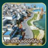
ทะเลสาบเอ๋อไห่คัง S