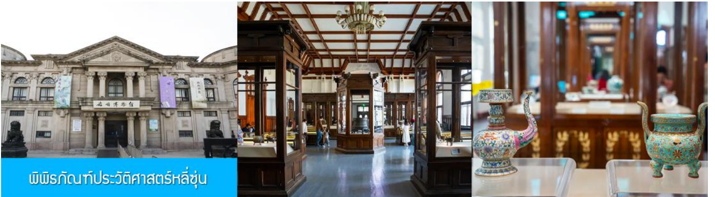
พิพิธภัณฑ์ประวัติศาสตร์หลี่ซุ่น

นำท่านเที่ยวชมและเก็บภาพ ณ สถานีรถไฟหลี่ซุ่น 旅顺火车站 เป็นสถานีปลายทางของเส้นทางรถไฟสาขา เลิ่นหยาง - ต้าเหลียน สร้างขึ้นในปีค.ศ. 1903 ออกแบบโดยสถาปนิกชาวรัสเซีย เป็นอาคารอิฐก่อปูนผสม โครงสร้างไม้ตามสถาปัตยกรรมรัสเซีย.