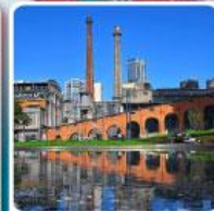
Eastern Suburb Memory Chengdu