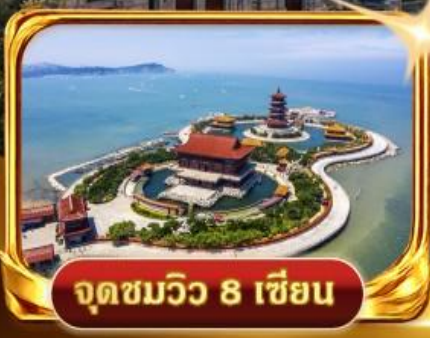
จุดชมวิวกว 8 เชียง