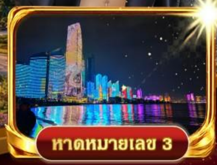
หาดหมายเลข 3