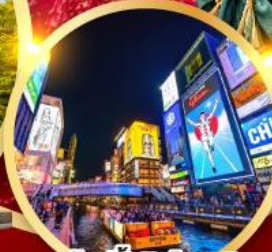
ช้อปปิ้งชินโจบาชิ