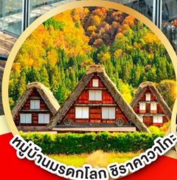
หมู่บ้านมรดกโลก ชิราคาวาโกะ