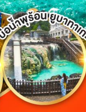
เขื่อนน้ำพุร้อนยูบะกาทาเกะ