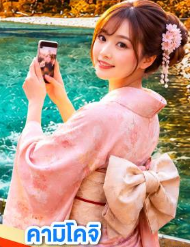
คาบิโคจิ