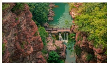
อุทยานสวรรค์หยุนโถซาน