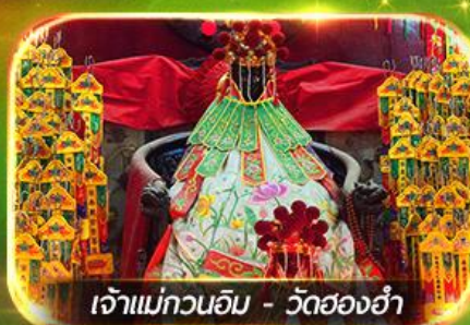
เจ้าแม่กวนอิม - วัดฮ่องกง