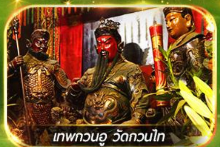
เทพกวนอู วัดกวนไท

ไหว้พระ-จัดเต็มขอพร 9 วัดดัง, นั่งกระเช้ามองปิง สักการะพระใหญ่โป้วหลิน ทะเลสาบดิสนีย์แลนด์ ชมพลุสุดอลังการ !!