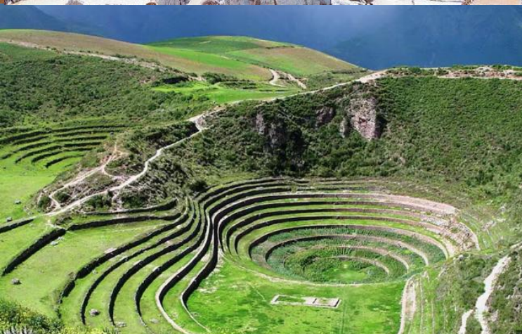
บ่าย นำท่านเดินทางสู่ มาราซ (Maras) แหล่งผลิตเกลือที่คุณภาพดีที่สุดในโลก ที่มีมาตั้งแต่สมัยอินคา แนวนาขั้นบันไดที่เรียงอยู่ตามลำดับความสูงของภูเขา จากนั้นเดินทางสู่ โมเรย์ (Moray) นาขั้นบันไดวงกลมขนาดใหญ่หลายๆรูปร่างแปลกตาที่ชาวอินคาทำไว้เพื่อทดลองปลูกพืชพันธุ์ต่างๆ จากจุดนี้สามารถมองเห็น หมู่บ้านอูรัมบัмба (Urubamba) ได้อีกด้วย ได้เวลาเดินทางกลับสู่เมือง เมืองคัสโก (Cusco) เมืองหลวงของอาณาจักรอินคา ที่แพร่ขยายอำนาจจนกินพื้นที่ 1 ใน 3 ของอเมริกาใต้ ตั้งอยู่เหนือระดับน้ำทะเลถึง 3,400 เมตร และเป็นแหล่งอารยธรรมยุคก่อนประวัติศาสตร์ที่ลึกลับน่าทึ่ง เป็นชุมชนเก่าแก่ของจักรวรรดิอินคาอันรุ่งเรือง ซึ่งยังคงทิ้งร่องรอยความเจริญไว้ให้เห็นเป็นซากปรักหักพังโบราณและโบราณวัตถุต่างๆ